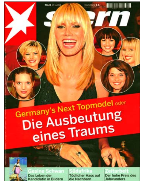
Mit 1.024.252 Exemplaren – davon 381.622 im EV – der (bislang) bestverkaufte STERN des Jahres

1,9 Millionen Exemplare verkaufte der STERN im ersten Quartal 1967 – das ist der absolute Auflagenhöchststand Zeit seines Bestehens. Damals gab das Haus Gruner + Jahr lediglich sieben Zeitschriften heraus – heute sind es in Deutschland 41 Titel, weltweit sogar 110. Aus dem Magazin STERN hat sich die Markenfamilie STERN entwickelt – mit dem zweimonatlich erscheinenden monothematischen Ableger STERN GESUND LEBEN, den monatlichen Titeln NEON und VIEW und dem viermal jährlich publizierten Sammlerobjekt STERN FOTOGRAFIE. Und natürlich: dem Onlineauftritt Stern.de sowie dem Fernsehma-